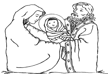
Nativity of the Blessed Virgin Mary

As our students start a new school year, we wish them all the best for their academic performance, for teachers - satisfaction at work, for parents - strength and contentment with the study results of their children; for all - God's blessings.